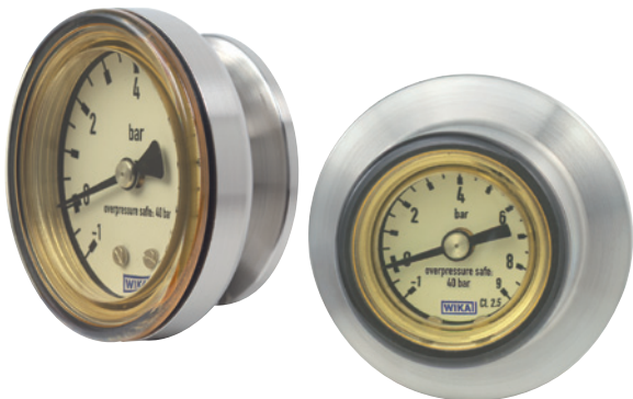
Diaphragm pressure gauge model PG43SA Fig. left: NS 63, Fig. right: NS 40